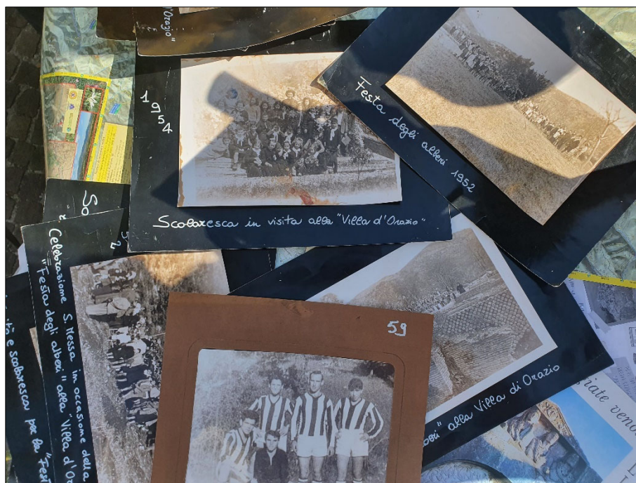
Figura 5. Fotografie storiche condivise dalla comunità di Licenza durante le attività di Archeologia pubblica nell'aprile 2022

conoscenza “aumentata” della cultura materiale delle comunità umane del passato vissute in quelle terre (fig. 5).