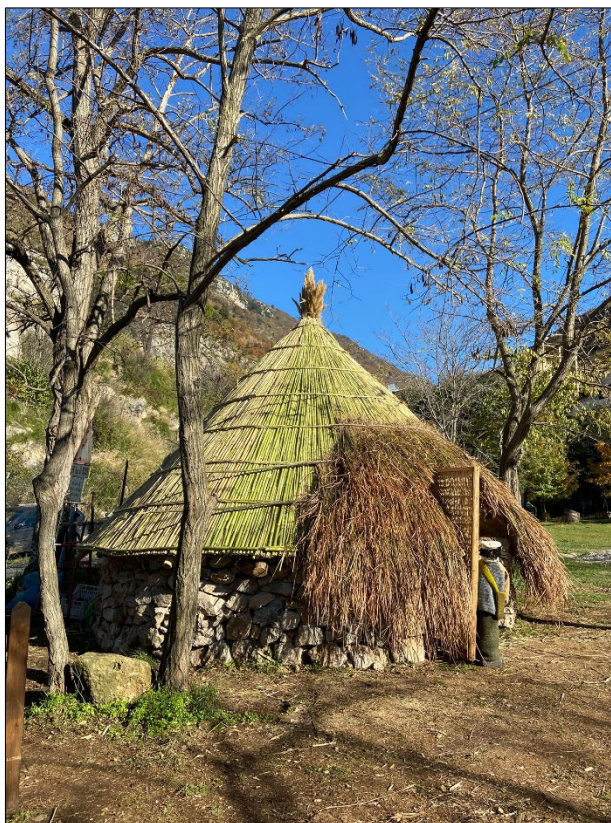
Figura 7. La "Capanna di comunità" realizzata a Marcellina

L'idea è stata promossa in particolare dall'associazione culturale "L'Agrifoglio", in sinergia con l'associazione locale "I Butteri", le quali hanno deciso di intraprendere insieme un percorso partecipativo di ricostruzione dei simboli culturali della comunità di Marcellina, un piccolo centro rurale nei dintorni di Roma che si è sviluppato intorno alla pastorizia, attività che fino a qualche decennio fa ha coinvolto intere generazioni originarie di questo luogo, come testimoniato dagli ultimi pastori ancora attivi sul territorio e intervistati nel corso dei laboratori partecipati (2023-2024).