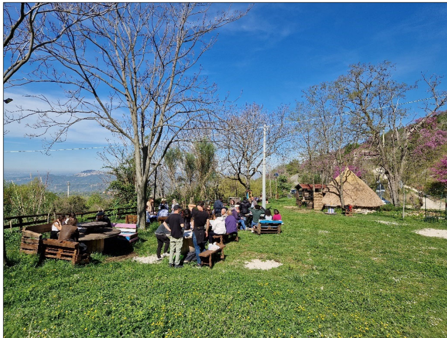
Figura 3. I laboratori partecipati tenuti ad aprile 2024 presso la “Capanna di comunità” a Marcellina

assistito la popolazione nella compilazione di un questionario strutturato a risposte aperte: sul territorio, sul patrimonio culturale, sull'ambiente e sulle tradizioni locali. Ogni questionario, elaborato in precedenza sulla base dei risultati archeologici emersi durante le ricerche territoriali condotte nell'ambito del progetto, è stato adattato alle specificità di ciascuna comunità 9 .