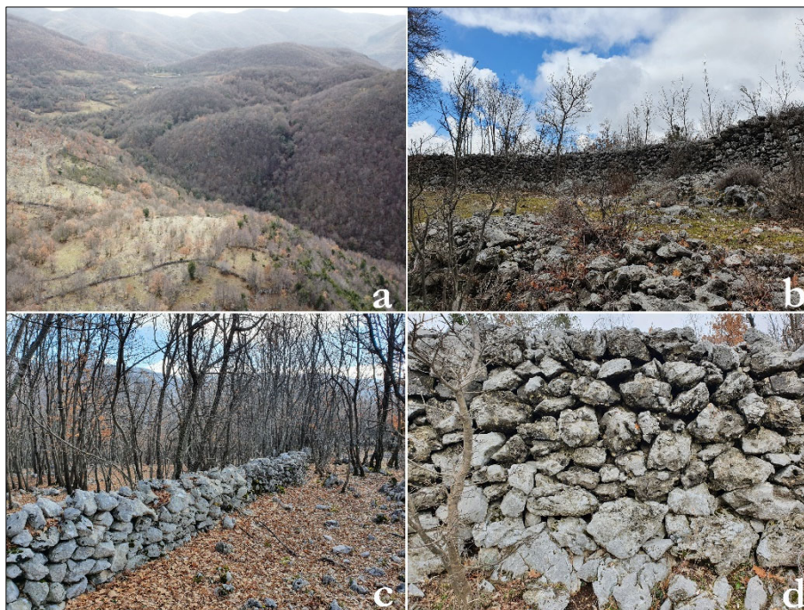
Figura 4. I muretti a secco nel territorio di Monteflavio. a) Recinzioni per attività agricole e per stabulazione; b) Muro di recinzione; c) Muro di delimitazione confine; d) Dettaglio della tecnica edilizia a secco in pietra calcarea locale

complessità del tema le ricerche su tali evidenze del paesaggio sono ancora in corso 14 .