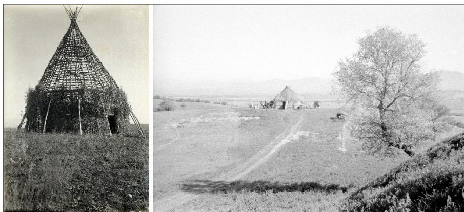
Figura 8. Il paesaggio della Campagna Romana tra fine Ottocento e prima metà Novecento. A sinistra: una capanna di pastori in costruzione nei pressi dell'odierna Lunghezza; a destra: una capanna tradizionale con il Monte Gennaro sullo sfondo

2003; fig. 8) 18 . Le capanne, strutture in materiale deperibile tipiche dell'edilizia rurale dalla complessa storia, che ritraggono nel corso dei secoli le molteplici modalità di adattamento dell'uomo in risposta alle esigenze economico-sociali e ai mutamenti dell'ambiente 19 , sono state utilizzate per scopi residenziali o per finalità produttive dai pastori della zona che vivevano e lavoravano, in forma stanziale o stagionale, all'interno di queste strutture realizzate con materiali recuperati nelle vicinanze (cfr. Alatri, 2015).