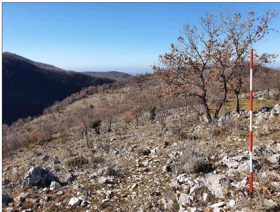
Figura 2. Il paesaggio dei Monti Lucretili nei dintorni del castello di Montefalco in Sabina

distretto territoriale dell'Italia centrale ubicato nella regione Lazio, tra le province di Roma e Rieti (Bernardi, Farinetti, Santangeli Valenzani, 2024) (fig. 1-2) 4 .