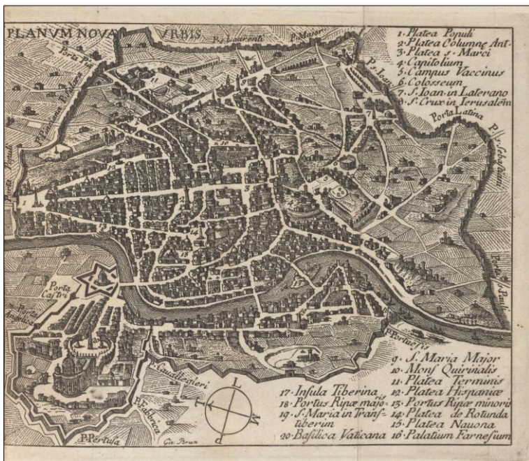
Figura 3. Mariano Vasi e Antonio Nibby, Itinerario istruttivo di Roma antica e moderna... , 1818, vol. I, Vetus Planum Urbis Romae , a sin.; Planum Nova Urbis , a destra