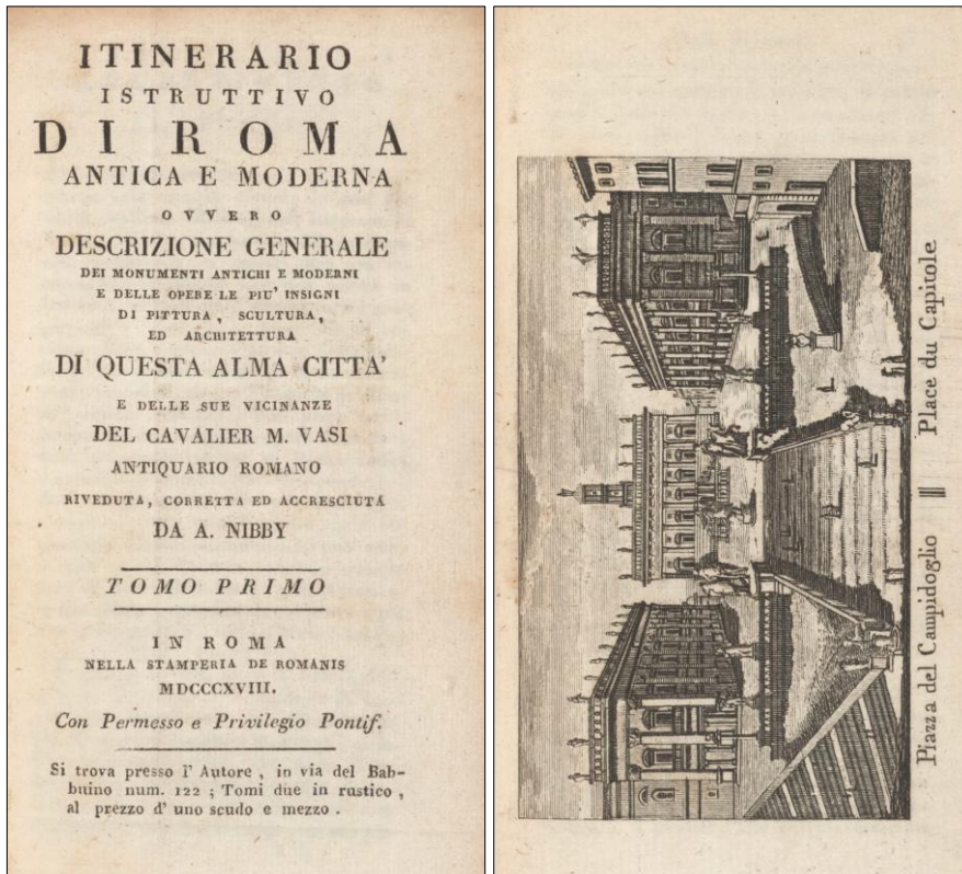
Figura 2. Mariano Vasi e Antonio Nibby, Itinerario istruttivo di Roma antica e moderna... , 1818, vol. I. Frontespizio, a sinistra; incisione raffigurante Piazza del Campidoglio, a destra

le principali modifiche apportate rispetto alle precedenti edizioni, e, sintetizzando i contenuti formali dell'opera, ne evidenzia le finalità e l'utilità (Ragonese, 2010). In alcuni casi particolari, come quelli curati da Antonio Nibby, essi trascendono questa loro primaria funzione e includono anche richiami agli incarichi ricoperti all'interno di istituzioni culturali e ai titoli accademici, tutti riferimenti atti ad avvalorare la competenza dell'autore e a consolidare il prestigio della sua guida 20 .