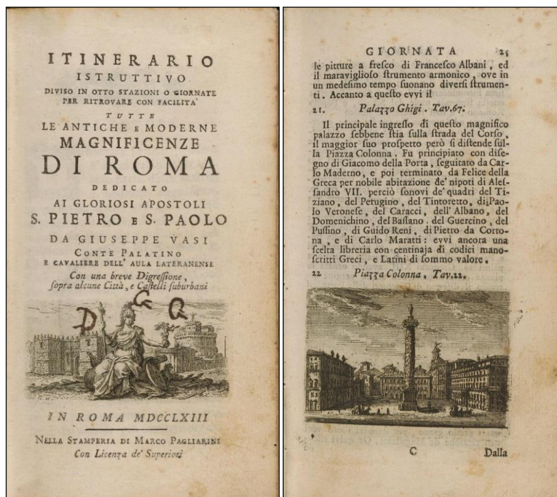
Figura 1. Giuseppe Vasi, Itinerario istruttivo diviso in otto stazioni o giornate... , 1763. Frontespizio, a sinistra; p. 25, a destra (fonte: https://archive.org/details/gri_33125008696169/page/24/mode/2up )