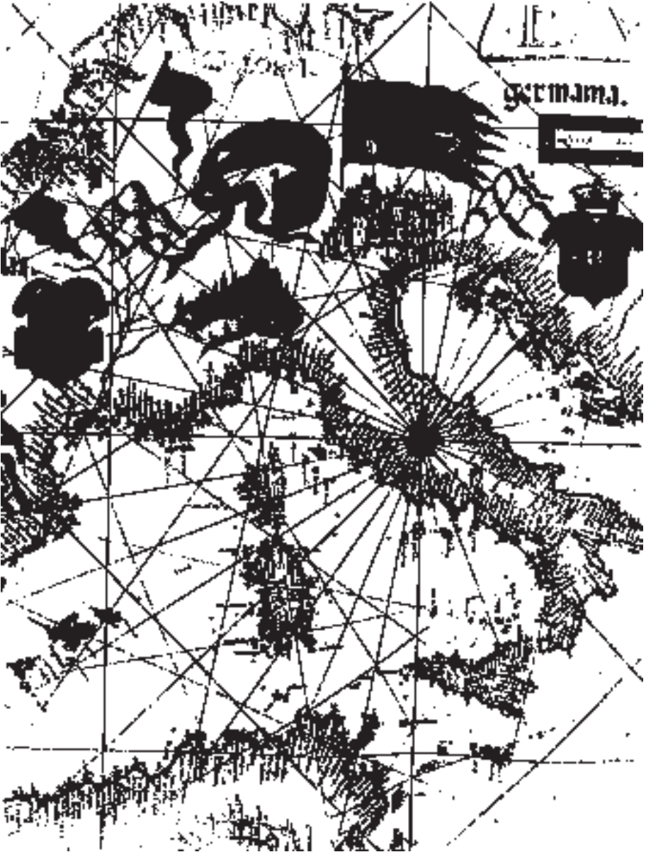
Fig. 1 - L'Italia nella Carta dell'Europa e del Mediterraneo, Biblioteca Nazionale di Firenze, 1563.