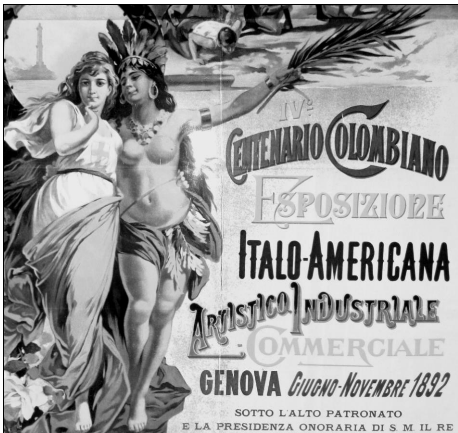
Figura 1. Particolare del manifesto ufficiale dell' Esposizione Italo-Americana artistico-industriale-commerciale per il Quarto centenario colombiano

L'iconografia proposta nel manifesto dal pittore Giovanni Grifo, infatti, raffigura Genova – e non l'intera Italia, per via dello scudetto bianco e rosso sul petto – come una vezzosa bionda fanciulla in abiti semplici (la tunica bianca a canottierina appartiene più alla ginnastica raccontata dal De Amicis, che alla mitologia) ma indiscutibilmente coprenti: mentre America è rappresentata come una nativa di pelle abbronzata, quasi completamente nuda eccezion fatta per un gonnellino, una collana e una corona composti esclusivamente di piume: indumenti che, per usare la terminologia dell'epoca, lasciano scoperto «l'onusto seno rosseggiante» (BOTTARO, 1984, p. 27).