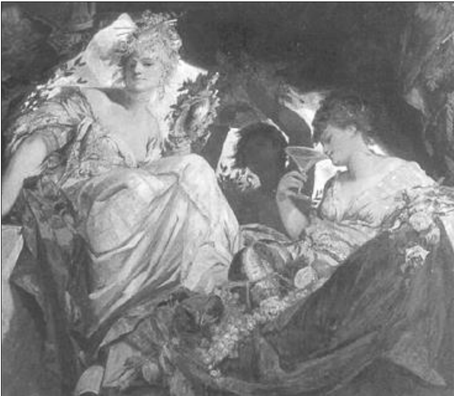
Figura 2. Hans Makart, particolare dell' Allegoria dei Continenti (Vienna, 1875): la nuova immagine dell'America è ormai una raffinata dama dell'alta società che sorseggia da un calice di cristallo champagne d'importazione

Ma l'America della scoperta non aveva più molto a che fare con "le Americhe" dei migranti: negli Stati Uniti, anche l'allegoria aveva subito una profonda trasformazione (magistralmente studiata da Hugh HONOUR, 1975, p. 251), identificando l'America con la Libertà: anche prima della famosa Statua che accoglie gli emigrati a New York dal 1885.